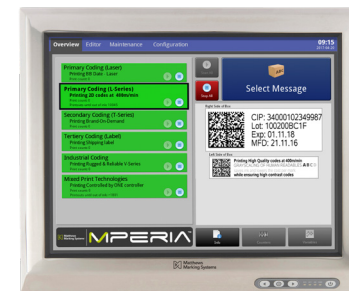
MPERIA® 15" Harsh Environment