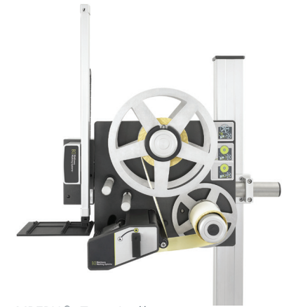
MPERIA® eTamp Applikator