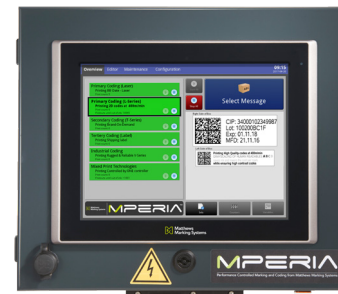
MPERIA® 12" Enclosed